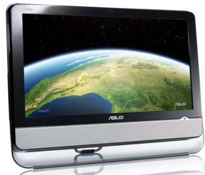
Montage / Befestigung