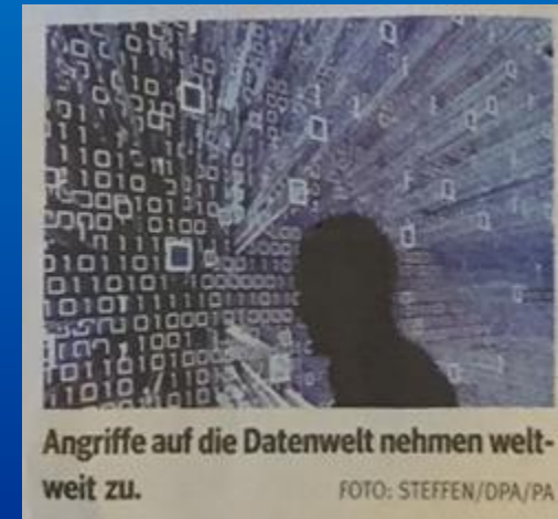
Angriffe auf die Datenwelt nehmen weltweit zu.